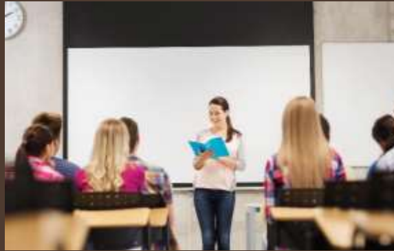
Ukuran & Bentuk Ruangan