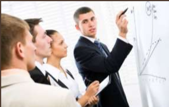
Peralatan yang Disediakan