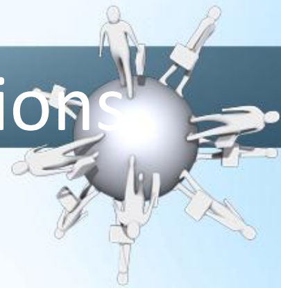
Table Locking and Transactions