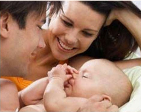
JARAK INTIM 0cm - 46cm