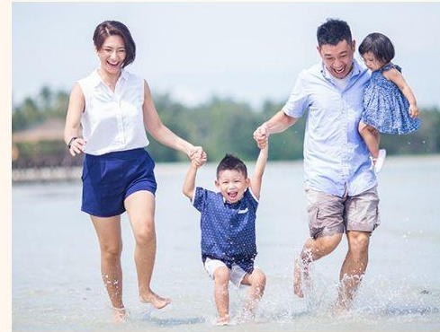
JARAK PERSONAL 46cm - 1,2 m