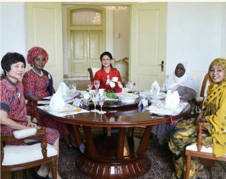
JARAK SOSIAL 1,2 m - 3,6 m