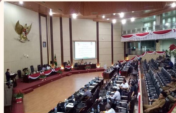
JARAK PUBLIK Lebih dari 3,6 m