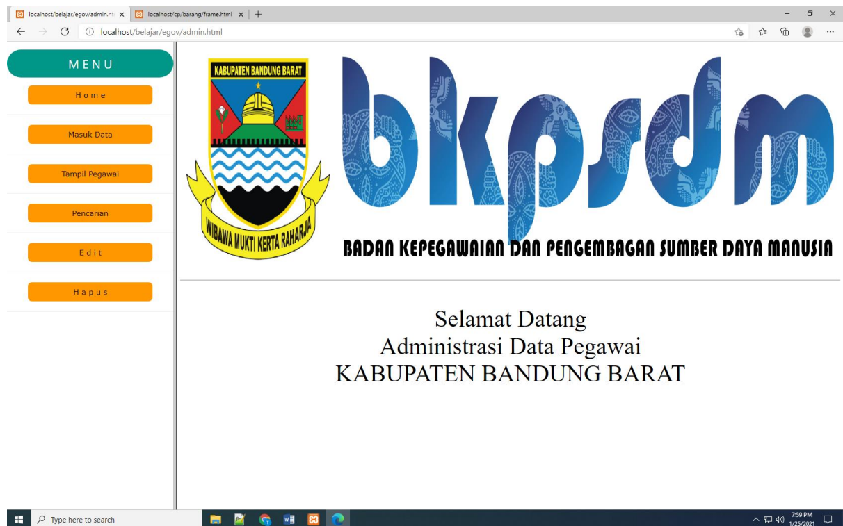
Gambar 14.1. Jendela Admin utama

Akan ditampilkan jendela seperti berikut: