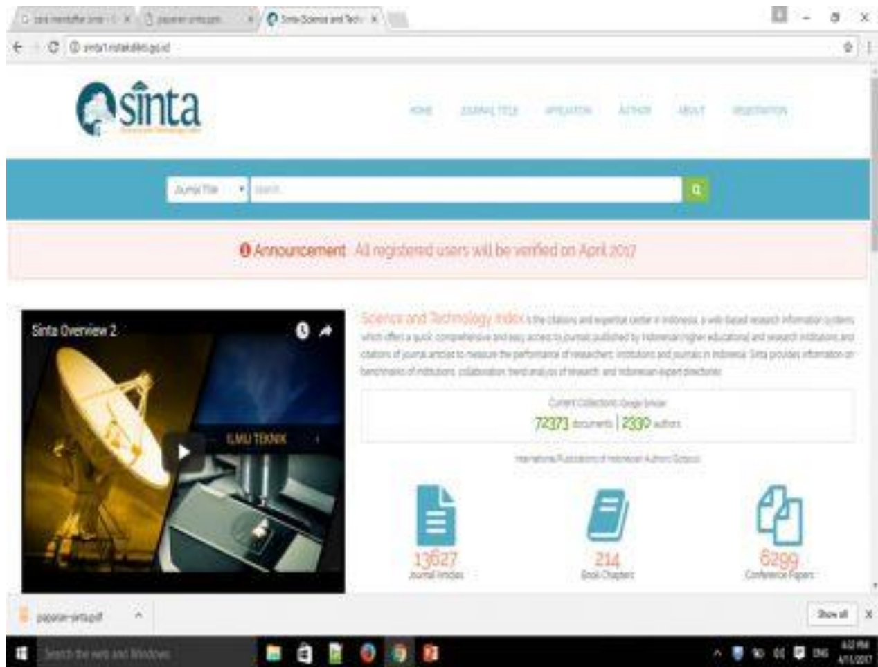
Gambar 1. Halaman Utama Sinta RistekDikti

Setelah masuk ke halaman utama, pilih Menu Registration selanjutnya akan ditampilkan halaman seperti berikut: