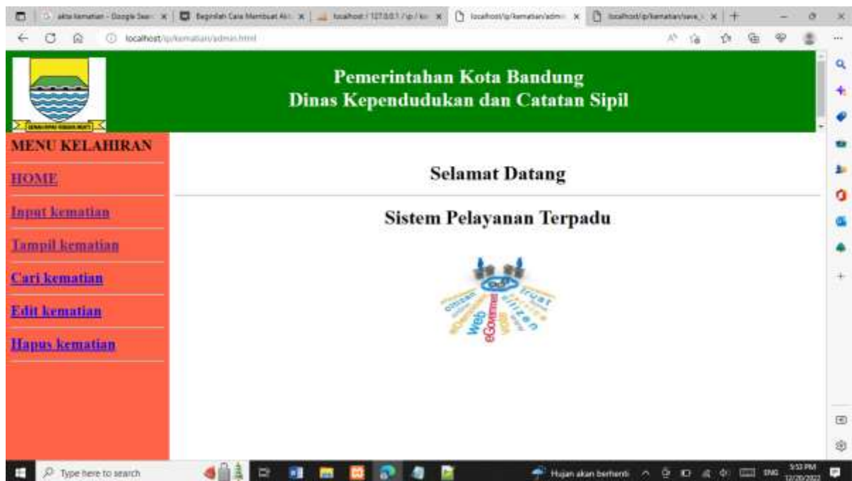
Gambar 9.4 Halaman Utama Menu Akta Kematian

Jika sudah beres dan tampilan seperti contoh, silahkan copy program dan tampilan screenshot masukan kedalam file Microsoft Word dengan Nama File: tugas9-nim-nama.docs , kemudian kirimkan ke https://kuliahonline.unikom.ac.id , paling telat hari minggu jam 19.00 WIB.