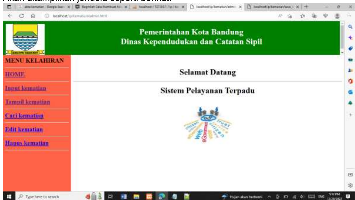
Gambar 9.1. Jendela Admin utama

Akan ditampilkan jendela seperti berikut: