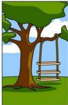
How the customer explained it