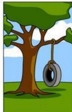
What the customer really needed