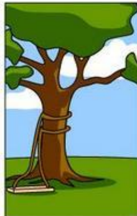
How the Programmer wrote it