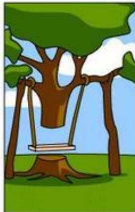
How the Analyst designed it