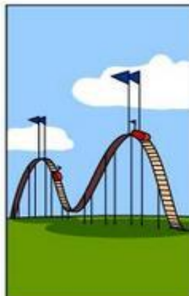
How the customer was billed