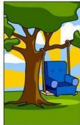
How the Business Consultant described it