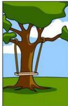
How the Project Leader understood it