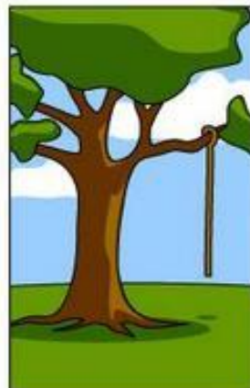
What operations installed